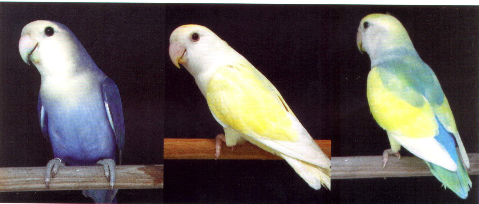
Roseicollis Cara Branca Cobalto