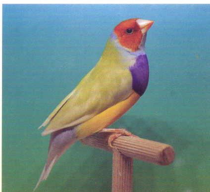
PASTEL VERDE PT RX CB LAR M