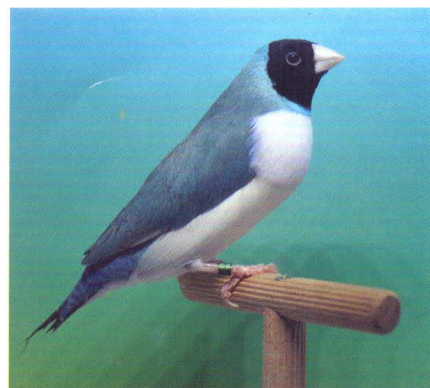
AZUL PT BR CB PT M