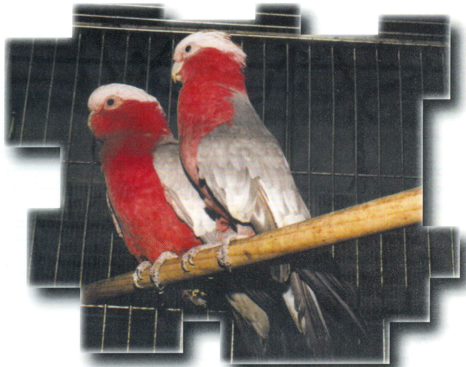
▲ CACATUA ROSA OU GALA