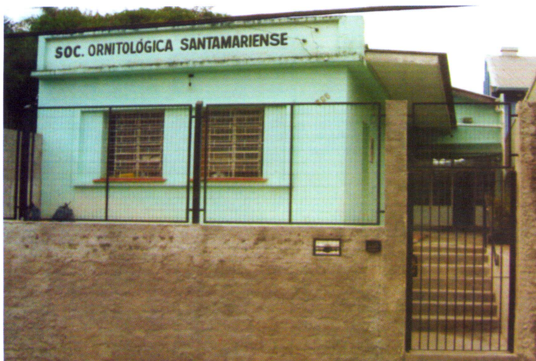
Ao fundo entrada do salão de eventos

Instituição sediará o campeonato estadual neste ano, mais uma oportunidade para se preparar bem para o Brasileiro