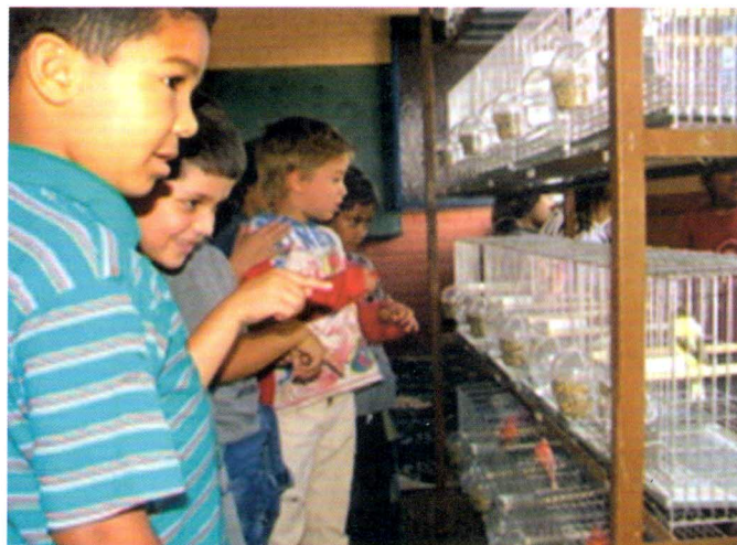
Projeto Canário, o pássaro de estimação – apresentação da canaricultura em escolas da região, em 2008, em Ceilândia, DF