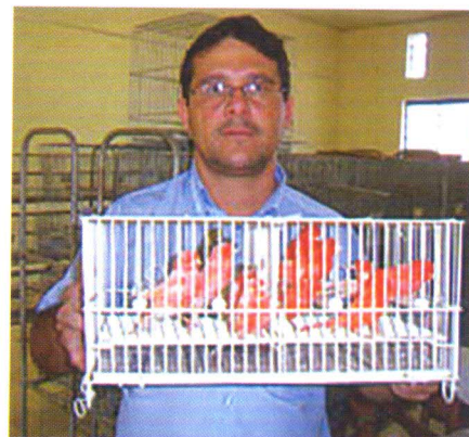
Tuca acredita que novos criadores têm de ter paciência

"Um amigo me levou a um evento e acabei comprando um casal de canários. Daí por diante, a paixão foi se desenvolvendo e acabei por participar do Brasileiro em 2005 – foi quando descobri que tinha canários de qualidade, porque